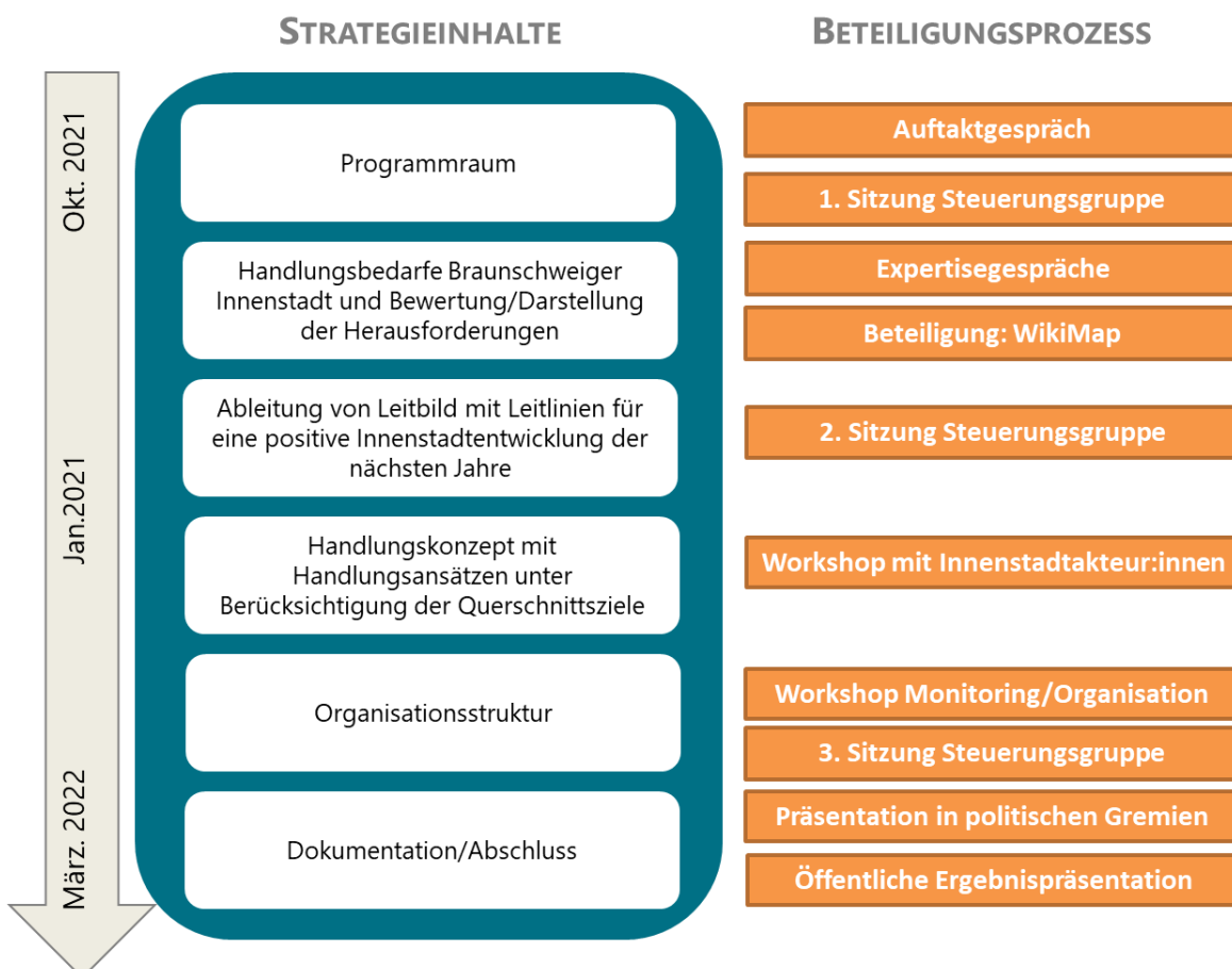
Abbildung 6: Prozessverlauf Strategieerstellung

Im Laufe des Prozesses fanden drei Sitzungen der Steuerungsgruppe für die Strategieerstellung statt. Die Ableitung des Programmraums, des Handlungsbedarfs und -konzepts, der Querschnittsziele und des künftigen Strategieumsetzungsprozesses wurde laufend vorgestellt und unter Einbezug fachübergreifender Expertisen und zivilgesellschaftlicher Akteur:innen diskutiert, um einen breiten, abgestimmten Konsens zu erzielen.