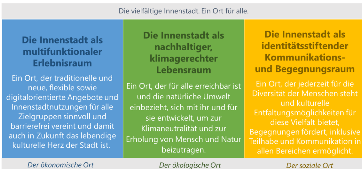
Abbildung 2: Das Leitbild für eine positive Innenstadtentwicklung

Auch die formulierten Querschnittsziele des strategischen Rahmenkonzepts wurden innerhalb aller Handlungsfelder berücksichtigt und finden sich damit im übergeordneten Leitbild wieder. Alle relevanten Akteursgruppen wurden hierfür in die Ausarbeitung und Abstimmung der Leitlinien sowie Handlungsfelder eingebunden.